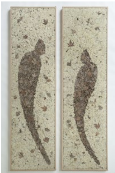
« Homme et Femme de la forêt I »