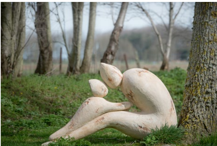
« Doux bisous »