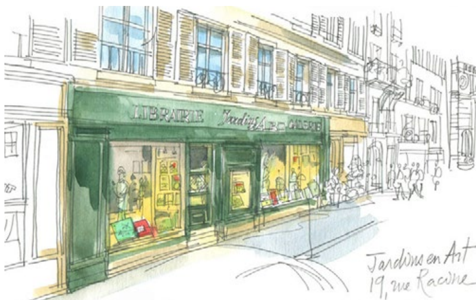
Illustration - Alain Bouldouyre ©

Parking : École de médecine - rue de l'École de médecine Parking : Souflot Panthéon - rue Souflot