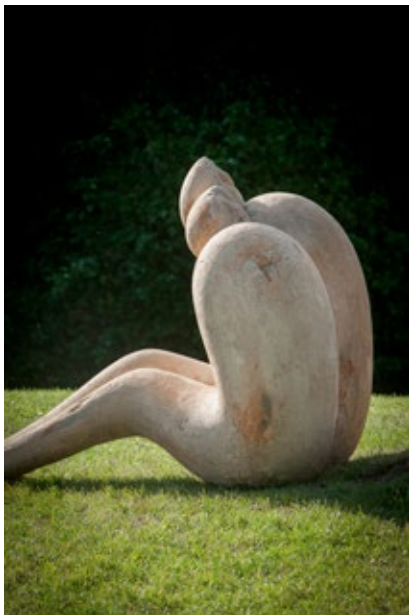
« les amants de Sebourg »