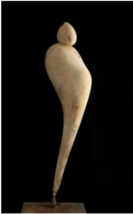
« Femme enceinte »