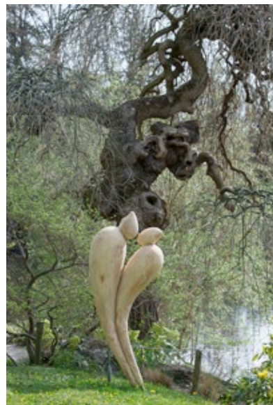
« Seuls au monde »