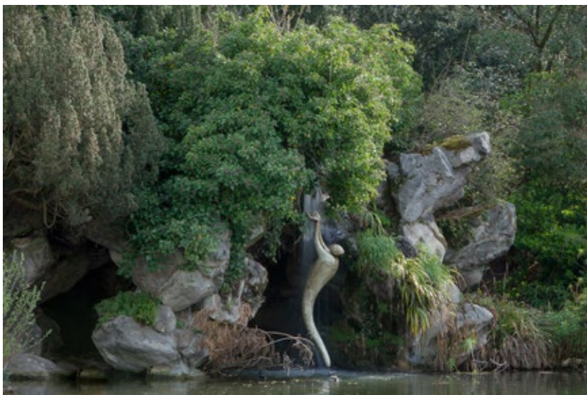
« Renaissance »