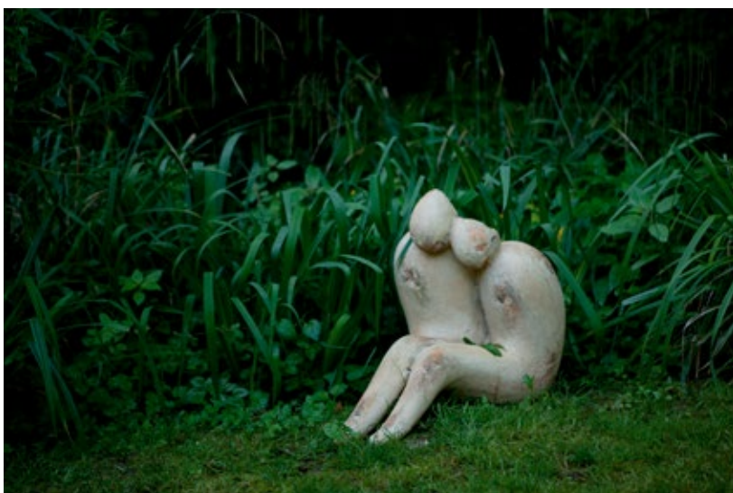
« les amants de Sebourg »