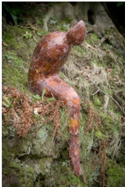
« Ondine de la forêt »