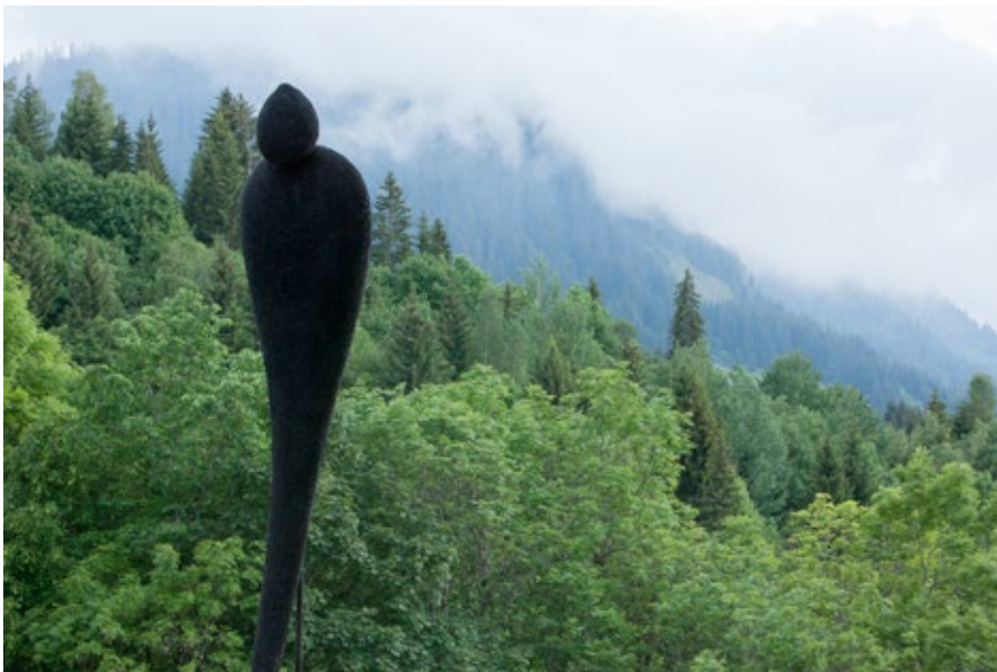
« Dame en noir »